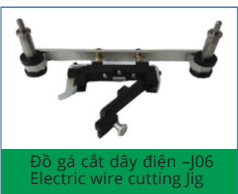
Đồ gá cắt dây điện -J06 Electric wire cutting Jig