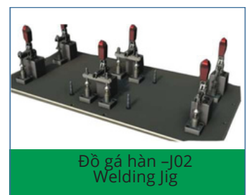
Đồ gá hàn -J02 Welding Jig