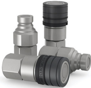
Hydraulic Flat-Face Quick Couplings