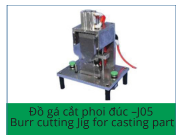
Đồ gá cắt phoi đúc -J05 Burr cutting Jig for casting part