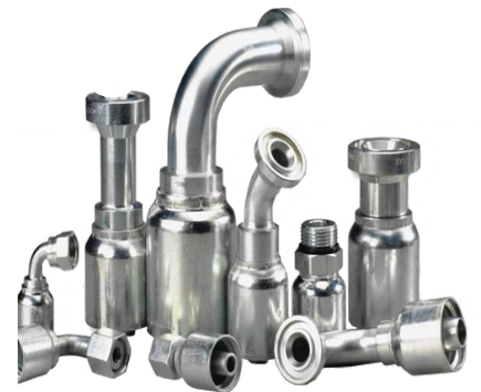
Cút nối thủy lực các loại