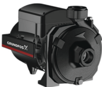
Bơm ly tâm