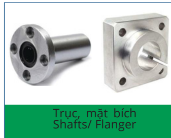
Trục, mặt bích Shafts/ Flanger