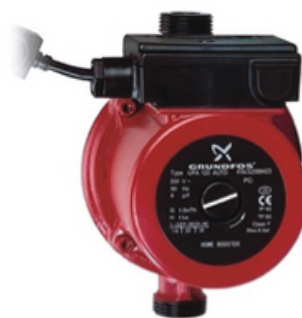
Bơm tăng áp tự động