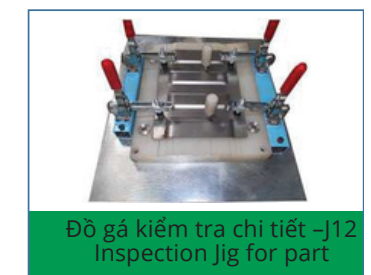
Đồ gá kiểm tra chi tiết -J12 Inspection Jig for part