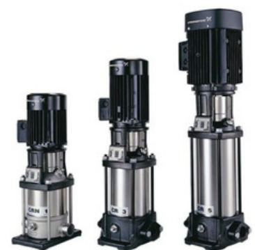
Bơm ly tâm đa tầng cánh trục đứng