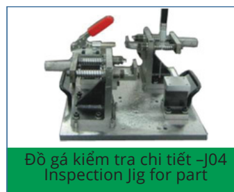
Đồ gá kiểm tra chi tiết -J04 Inspection Jig for part