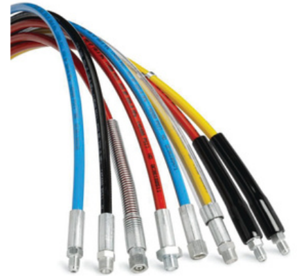
Ultra High-Pressure Hydraulic Products