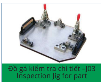
Đồ gá kiểm tra chi tiết -J03 Inspection Jig for part