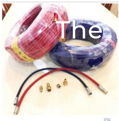
Dây Teflon chịu nhiệt