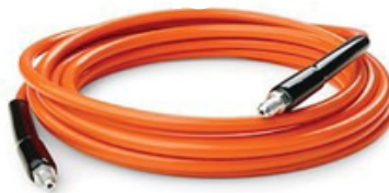
Dây dẫn nước làm mát