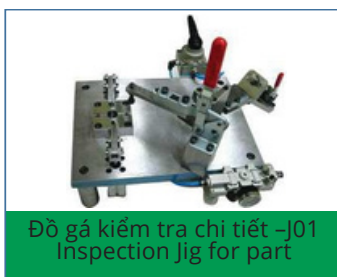
Đồ gá kiểm tra chi tiết -J01 Inspection Jig for part