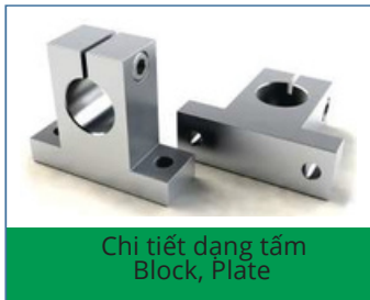
Chi tiết dạng tấm Block, Plate